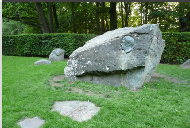
Augsburg市のディーゼル石庭苑 (ヤンマー寄贈)

機械工学を専攻し、1957年にヤンマー入社。国内および海外留学を経て、主にエンジンの研究、海外事業に従事。1978年常務取締役、海外事業本部長に就任。退任後も、ヤンマー顧問、内燃機関連協会の会長、山岡育英会の評議員などを歴任されている。